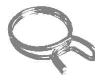
Federdrahtschelle * (exemplarische Abb.)

* handelsübliches Zubehör, das nicht bei FLECK erhältlich ist