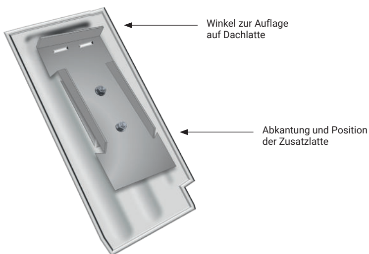
Abb. 2: Schematische Darstellung der Unterseite

* handelsübliches Zubehör, das nicht bei FLECK erhältlich ist