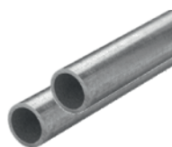
Rohre (Ø 30 – 40 mm) * (exemplarische Abb.)